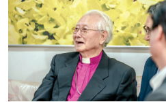
'나눔은 늘 처음처럼' - 노블어니클럽 1호, 김성수 주교