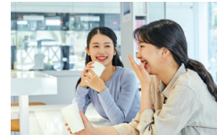
'홀로서는 나, 함께 서는 법을 배웁니다.' - 자립준비청년 서연, 지원 *개인정보보호를 위해 가명과 자료사진을 사용했습니다.