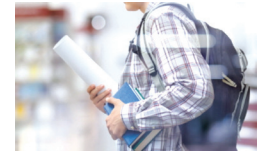
'포기하지 않도록 지지대가 되어주셔서 감사합니다.' - 자립준비청년 정우 *개인정보보호를 위해 가명과 자료사진을 사용했습니다.