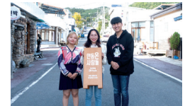
'안동 예끼마을에서 지방 소멸을 해결하는 촌락 단위 삶의 모델을 만들고 싶습니다.' - 지역 청년 지원사업 활동단체 유유자적